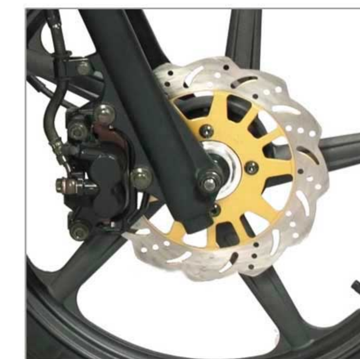
ترمز دیسک جلو