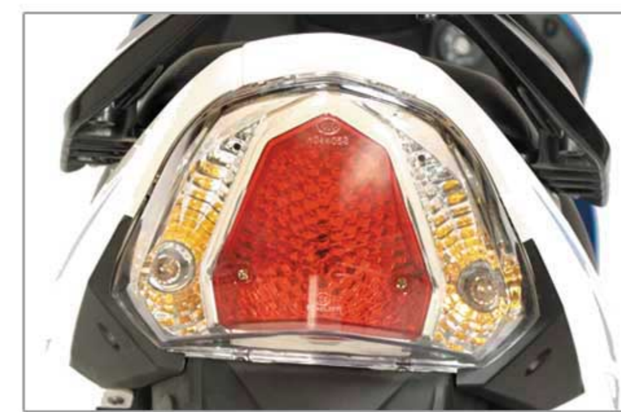
چراغ خطر عقب