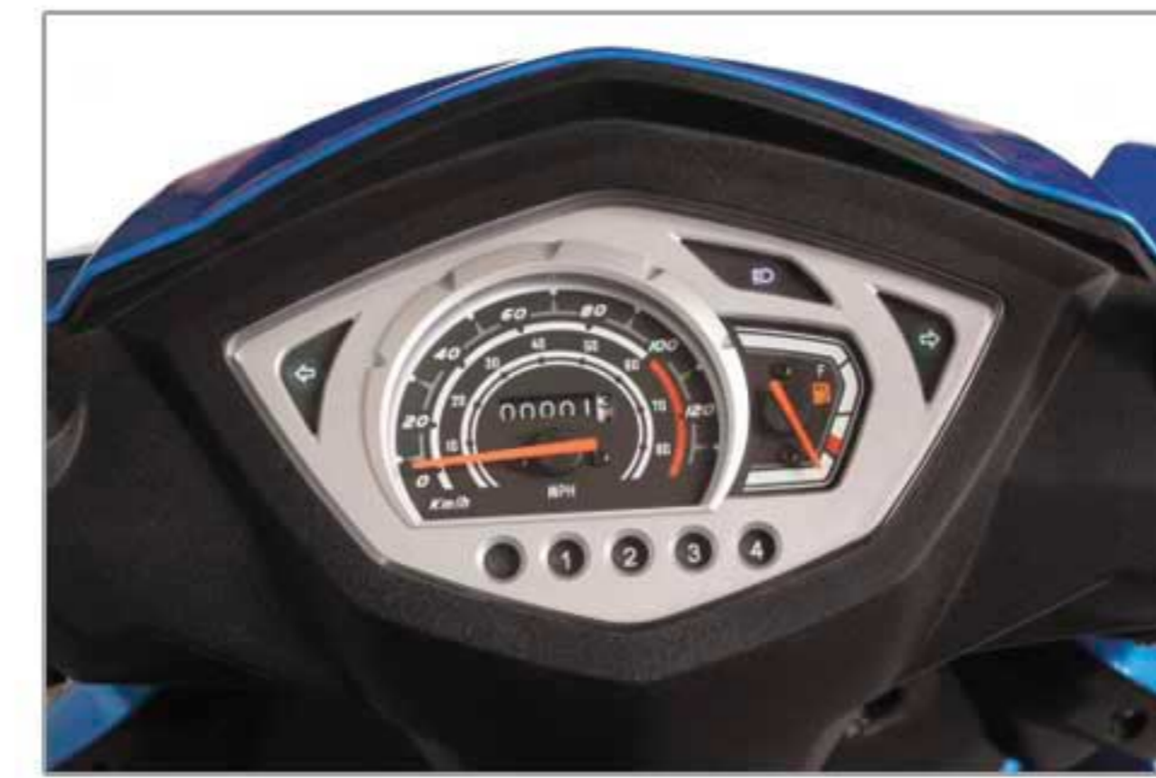
صفحه کیلومتر با نمایشگر زنده