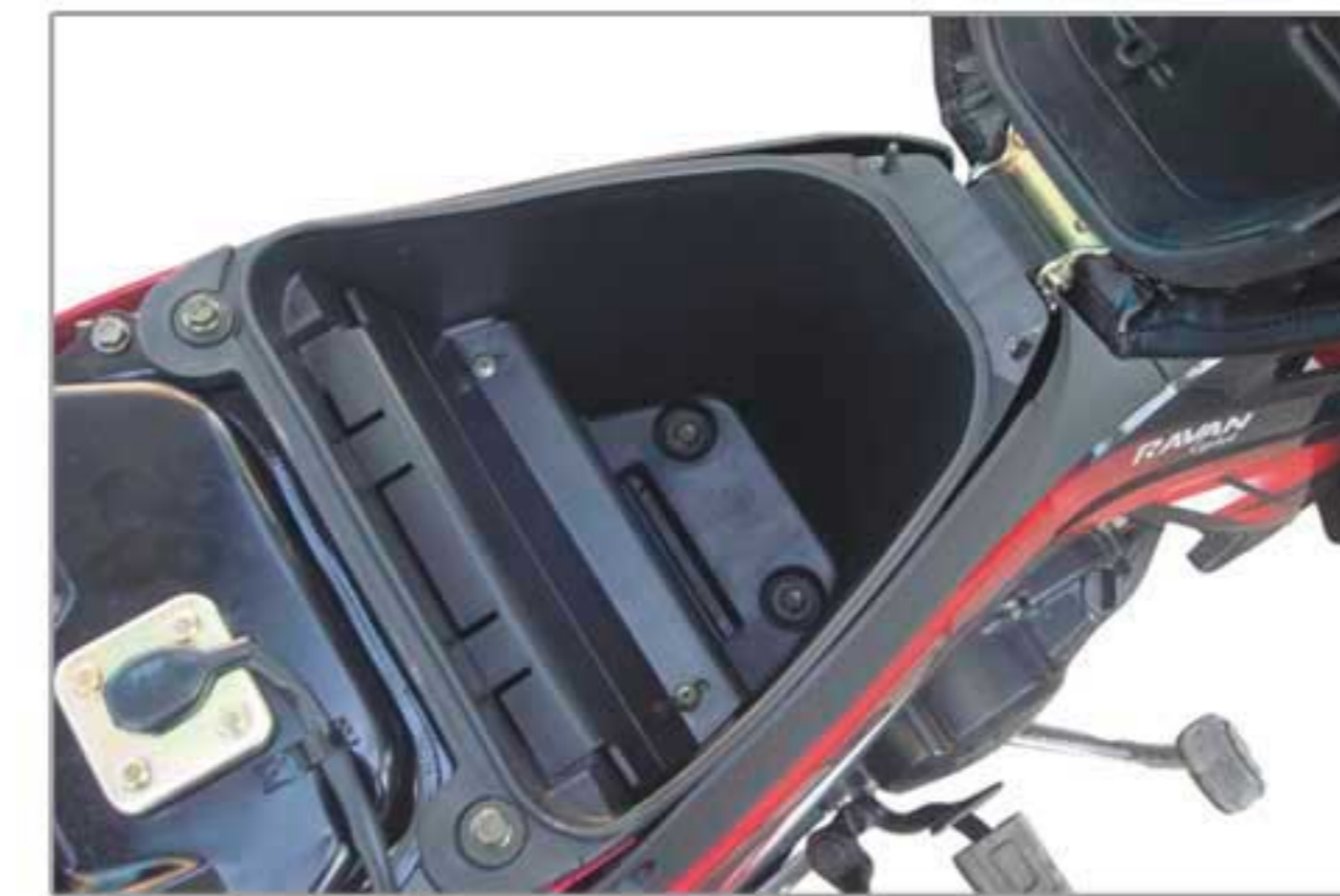
فضای مناسب در زیر زین